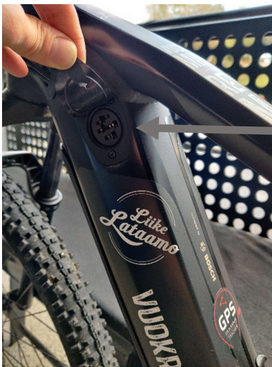
Latauspistokkeen tulppa ja latauspistoke