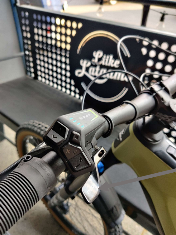
Satulatulpan korkeuden säätö (hissitolppa)